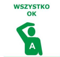
PRAWA LUB LEWA RĘKA POŁOŻONA NA GŁOWIE

W przypadku zauważenia łodzi lub na zapytanie sędziego zawodnik sygnalizuje, że nie ma żadnych problemów.