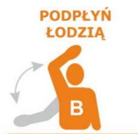
WYMACHIWANIE PRAWĄ LUB LEWĄ RĘKĄ

W przypadku zauważenia łodzi lub na zapytanie sędziego zawodnik sygnalizuje, że nie ma żadnych problemów.