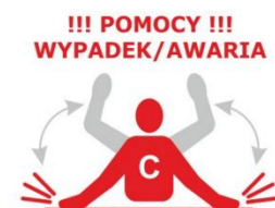
UDERZANIE JEDNĄ LUB OBIEMA RĘKOMA O TAFLE WODY

Zawodnik po nawiązaniu kontaktu wzrokowego z łodzią prosi o jej podpłynięcie.